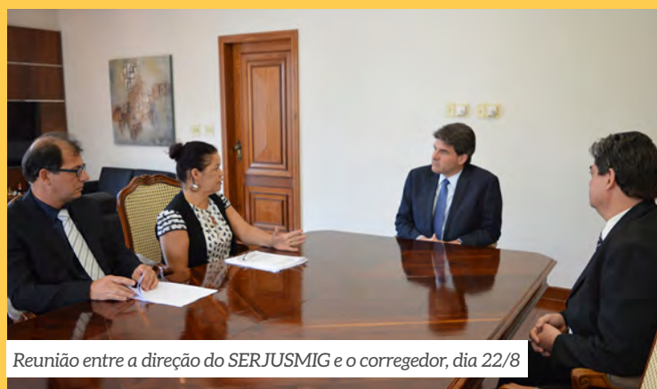
Reunião entre a direção do SERJUSMIG e o corregedor, dia 22/8