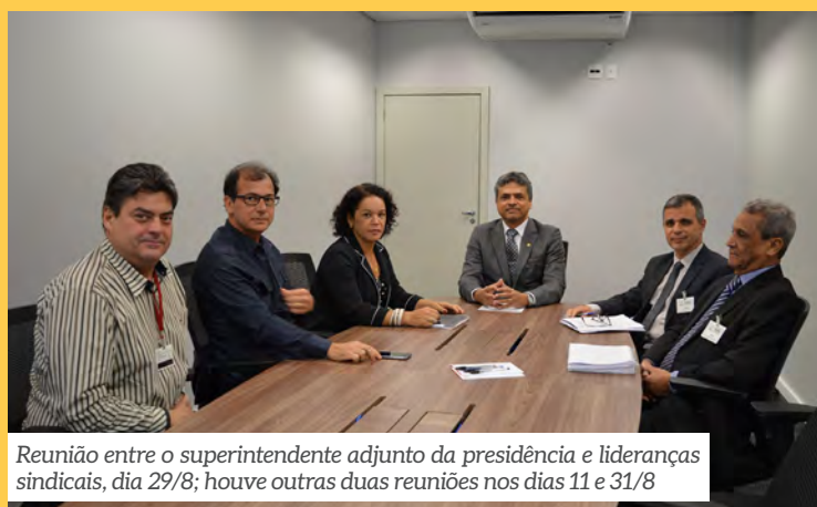
Reunião entre o superintendente adjunto da presidência e lideranças sindicais, dia 29/8; houve outras duas reuniões nos dias 11 e 31/8