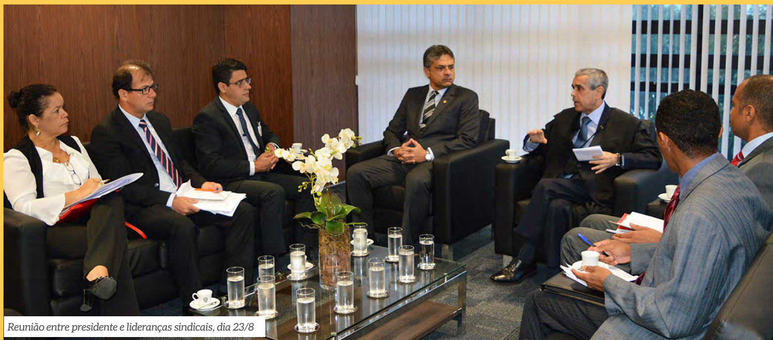
Reunião entre presidente e lideranças sindicais, dia 23/8