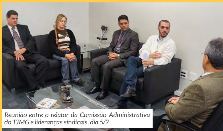
Reunião entre o relator da Comissão Administrativa do TJMG e lideranças sindicais, dia 5/7

Gratificação e outros - Está prevista a continuidade do pagamento da gratificação aos escrivães e contadores. Estão também previstas reservas para o pagamento de passivos, parcelas de URV e equivalência salarial, indenização de férias vencidas e nomeação de magistrados e Servidores. A proposta passa agora pelos crivos do Executivo e do Legislativo.