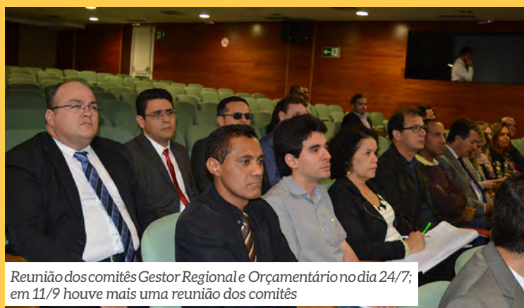
Reunião dos comitês Gestor Regional e Orçamentário no dia 24/7; em 11/9 houve mais uma reunião dos comitês